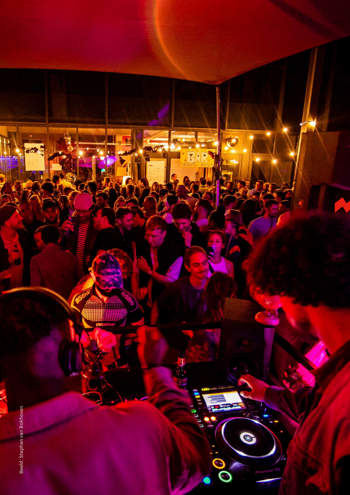
Beeld: Stephen van Bokhoven