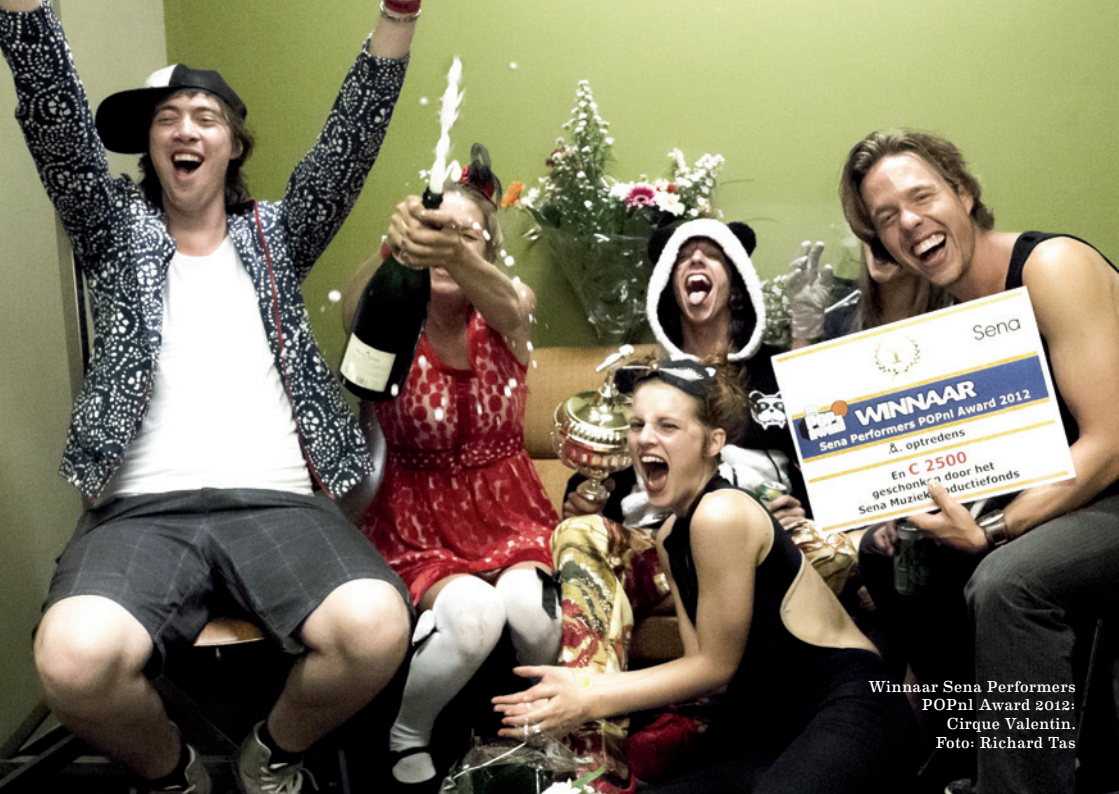
Winnaar Sena Performers POPnl Award 2012: Cirque Valentin.