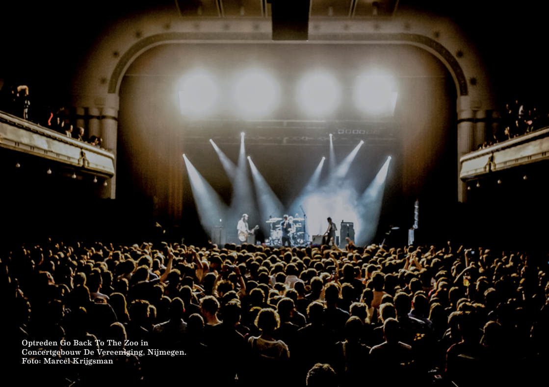
Optreden Go Back To The Zoo in Concertgebouw De Vereeniging, Nijmegen.