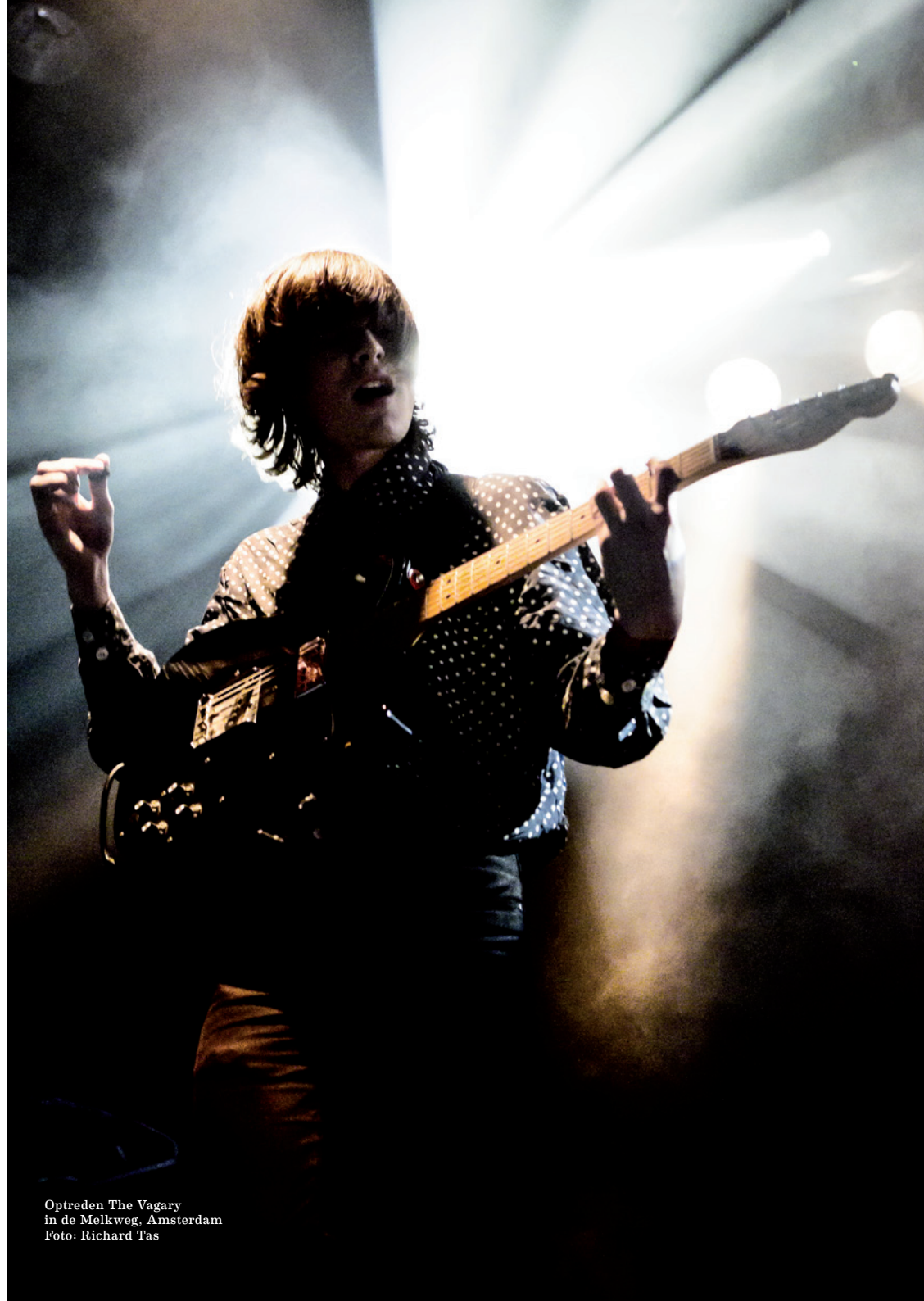
Optreden The Vagary in de Melkweg, Amsterdam

De waarde van pop wordt de Nederlandse gemeenten aangeboden zodat zij zich kunnen versterken met een aantrekkelijk, duurzaam en onderscheidend popcultureel ondernemersklimaat.