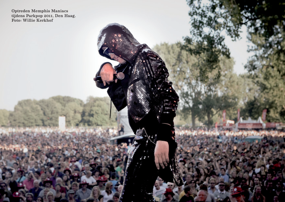
Optreden Memphis Maniacs tijdens Parkpop 2011, Den Haag.

zelf leren spelen, optreden en -voor sommigen- een professionele muziekcarrière.