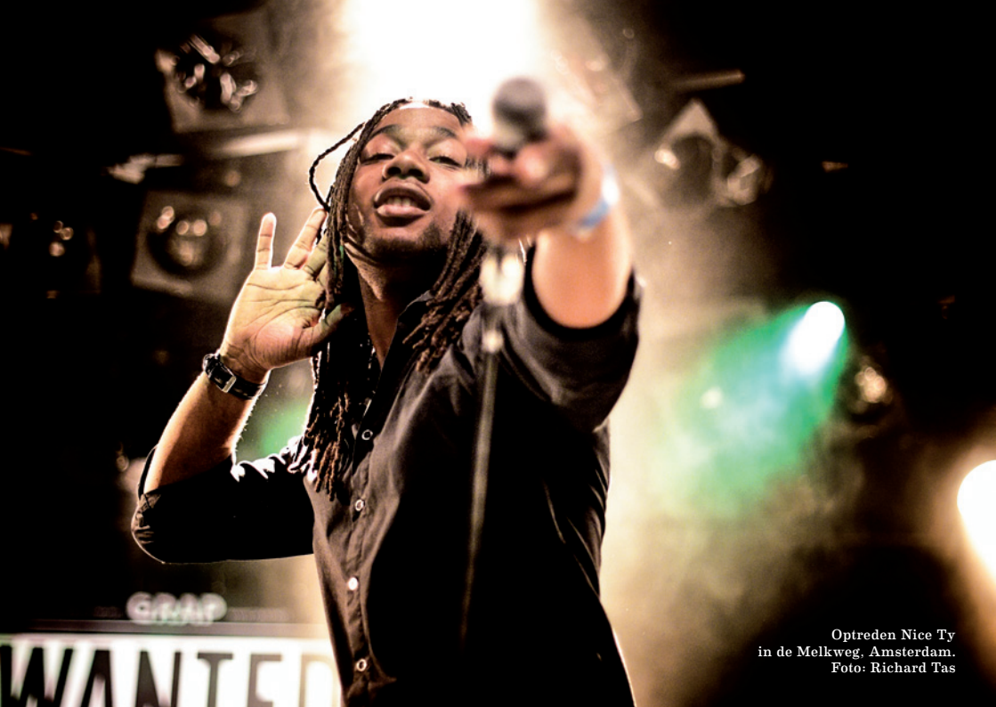
Optreden Nice Ty in de Melkweg, Amsterdam.