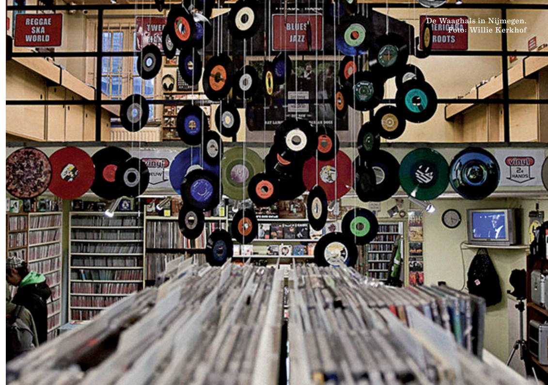
De Waaghals in Nijmegen.