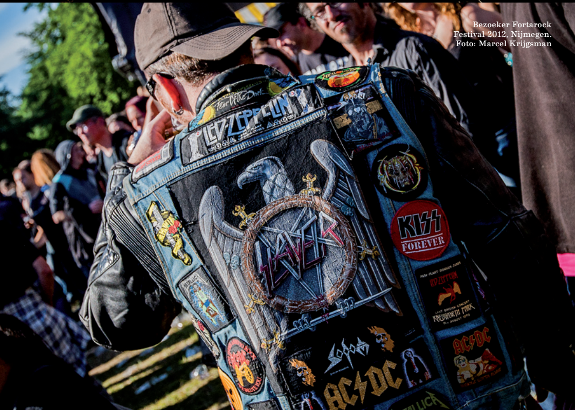
Bezoeker Fortarock Festival 2012, Nijmegen.