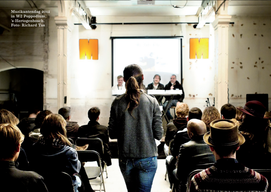
Muzikantendag 2012 in W2 Poppodium, 's-Hertogenbosch.

van een cd en -voor sommigen- een professionele muziecarrière. De aanwezigheid van een volledige keten is belangrijk om talentontwikkeling te kunnen faciliteren en ondersteunen.