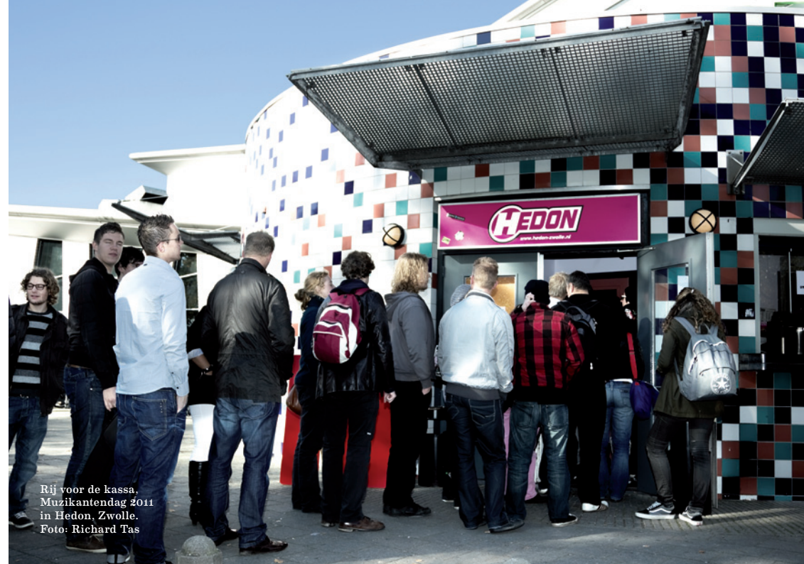
Rij voor de kassa, Muzikantendag 2011 in Hedon, Zwolle.