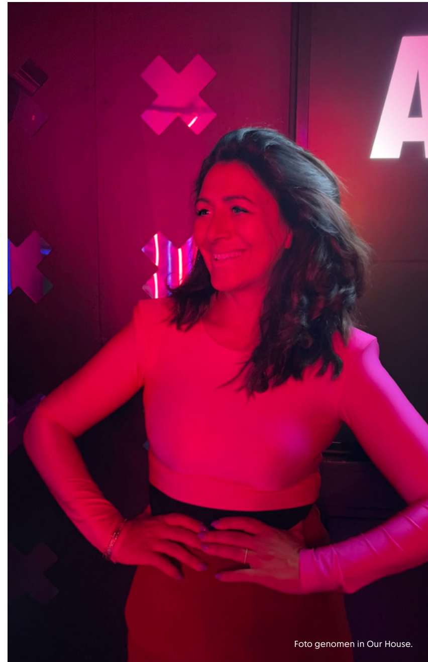
Foto genomen in Our House.